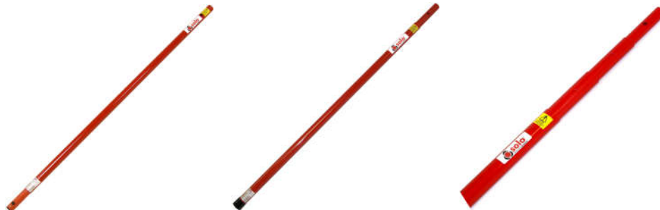
Solo 101 1 segment (1,13 m)